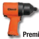
Serie CWC Premium Composite

Cleco beliefert die Industrie seit über 120 Jahren weltweit mit hochwertigen Werkzeugen. Die Produktpalette der Cleco Schlagschrauber umfasst Werkzeuge die u.a. für Werkstätten und Reifenhändler entwickelt wurden, bietet aber mit der CWM Baureihe auch ultrarobuste Schlagschrauber, die für die härtesten Industrieumgebungen ausgelegt sind. Wenn so manch anderer Schlagschrauber an Leistung verliert, häufige Serviceintervalle benötigt oder zu früh Fehler aufweist, halten unsere Cleco Schlagschrauber durch und begleiten Sie zuverlässig bei den anspruchvollsten Schraubaufgaben. Wenn Sie schrauben müssen nehmen Sie Cleco. Zählen Sie auf die beständige Qualität der Cleco Schlagschrauber.